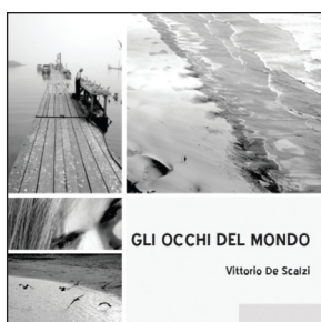
GLI OCCHI DEL MONDO (2011) Aereostella