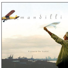
MANDILLI (2008) Aereostella