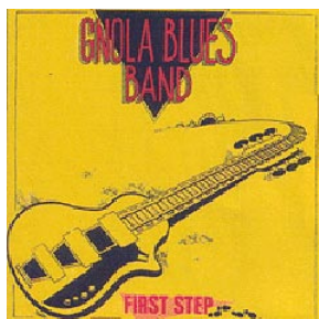
FIRST STEP (1990)