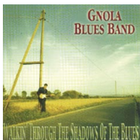
WALKIN' THROUGH THE SHADOWS OF THE BLUES