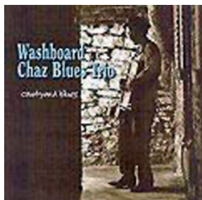
COURTYARD BLUES (2002) by Corrugated Records