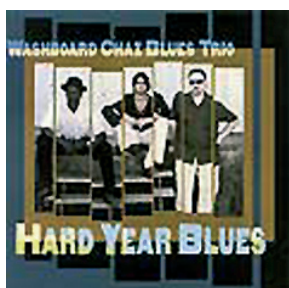
HARD YEAR BLUES (2006) by Independan