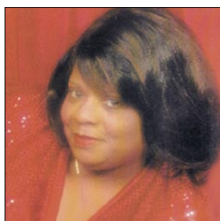
“Miss Red Riding Hood” - Ichiban Old Indie, 2001