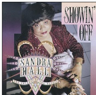
“Showin Off” - Ichiban Old Indie, 1995 Produttore LeBron Scott