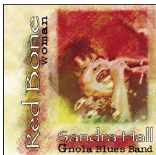
Red Bone Woman - Slang Music Records, 2006

Un cd pieno di jam di grandi musicisti realizzati con la voce di un'incredibile cantante. Un altro gioiello di aggiungere alla collezione.