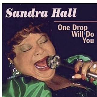
“One Drop will do you” - Ichiban Old Indie, 1997