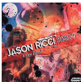
ROCKET NUMBER 9 (2008) Eclecto Groove Records