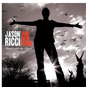
DONE WITH THE DEVIL (2009) Eclecto Groove Records