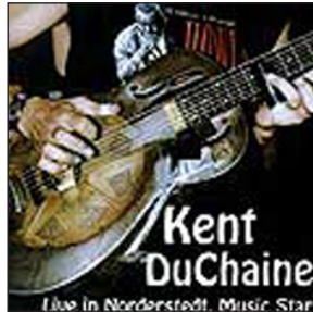
LIVE AT MUSIC STAR (2000) By Cadillac Records/New Morning Records