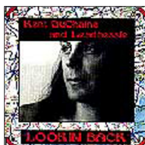
LOOKING BACK (1993) By Cadillac Records