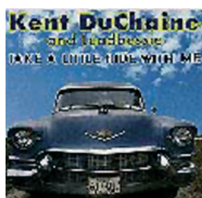
TAKE A LITTLE RIDE WITH ME (1995) By Cadillac Records