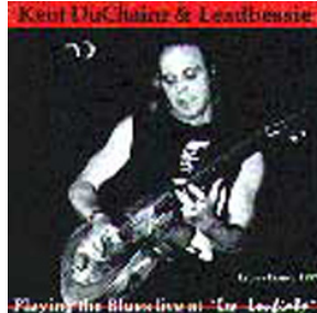
PLAYING THE BLUES Live at "Les Loufiats" (1997) By Cadillac Records