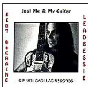
JUST ME AND MY GUITAR (1991) By Cadillac Records