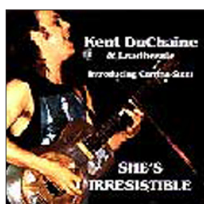
SHE'S IRRESISTIBLE (1996) By Cadillac Records